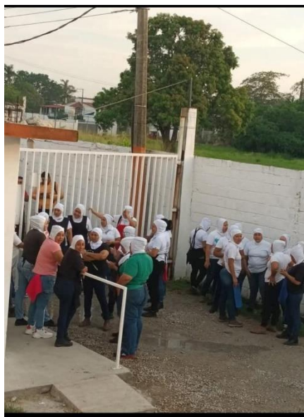
Evidencia de la manifestacion por la inconformidad 24 mayo 2025

Es aquí donde la empresa debe tener en cuenta en que esta fallando, ya dimos las posibles soluciones en el marco anterior en lo que la entidad debe hacer y llevar una mejor contabilidad, en este ppeel entramos nosotros ya que estaremos pendiente de la repuesta de la empresa y es donde nos hacemos preguntas de que hacer si no lo vemos claro, es hacer la propuesta que la empresa de un tiempo determinado para haber en cuanto tiempo lo puede pagar, en esto podemos decir que ya hay una respuesta ahora falta que se cumpla, si esto pasa del tiempo dado es donde ya se suele irse legalmente para meter mas presion y ser masjusto por que no cumplieron con su palabra es donde entra en defensa como respaldo el contratato donde la empresa esta aceptando las prestaciones.